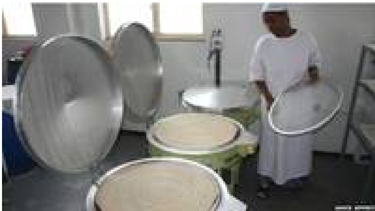
Después de varios minutos la injera está lista.