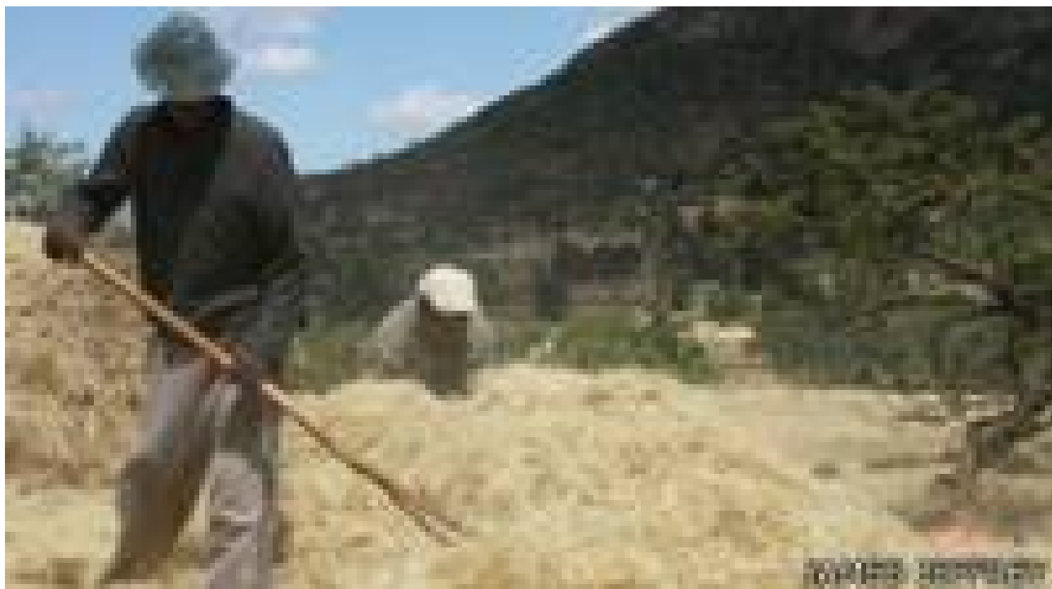
El teff ha sido cultivado en Etiopía desde hace milenios.

Pero al mismo tiempo Sirak-Kebede cree que el gobierno etíope no debería desperdiciar una oportunidad global que podría beneficiar a más de seis millones de agricultores, al tiempo que supondría el ingreso de muy valiosas divisas extranjeras.