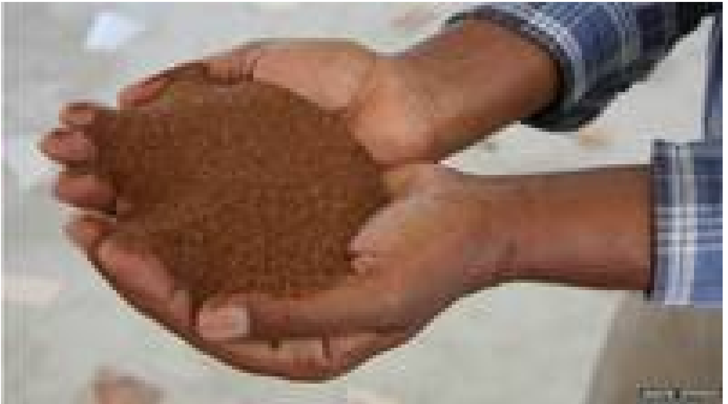
Los granos de teff son tan pequeños como las semillas de amapola.

Los etíopes han cultivado el teff desde hace milenios, pero el producto ahora parece estar atrayendo la mirada del resto del mundo: podría convertirse en el nuevo "supergrano" para los mercados europeo y norteamericano, superando a la quinua y a la espelta.