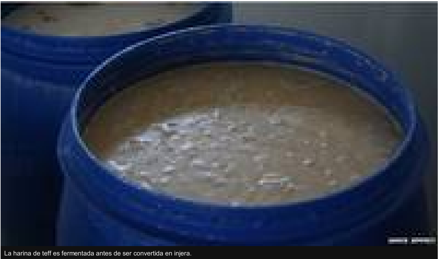
La harina de teff es fermentada antes de ser convertida en injera.

De alto contenido en proteínas y calcio y libre de gluten, el teff está ganando popularidad a nivel internacional.