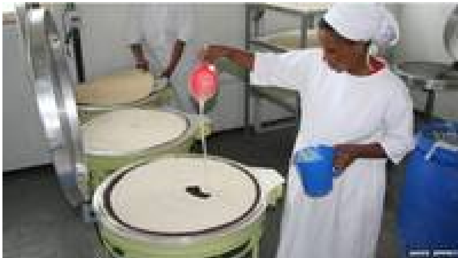
La injera se calienta como si fuera una tortilla.