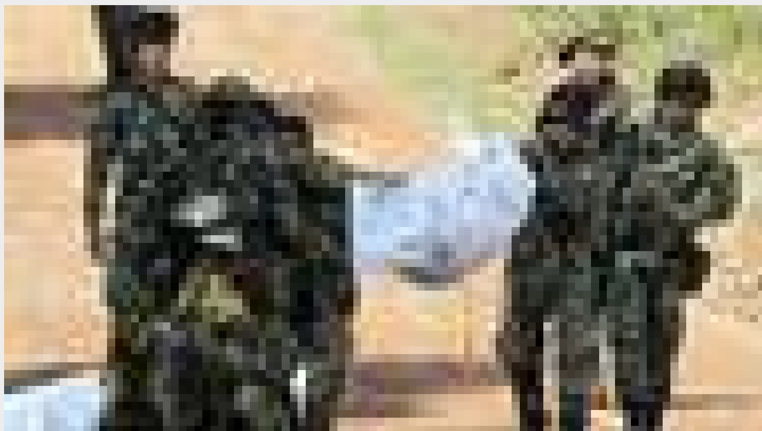
Colombia reanudará bombardeos tras ataque atribuido a las FARC