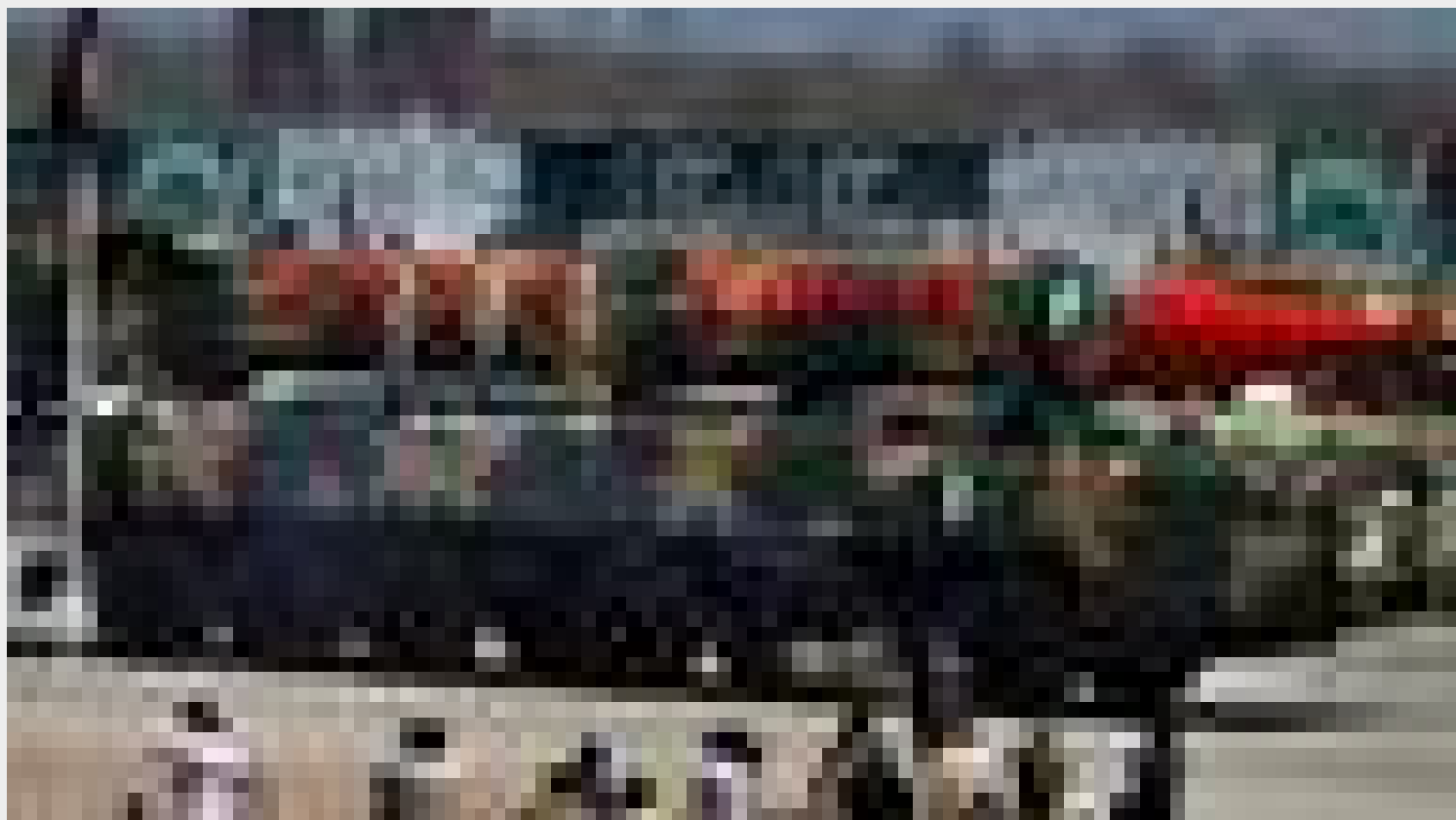
La carrera por armas nucleares de la que casi no se habla